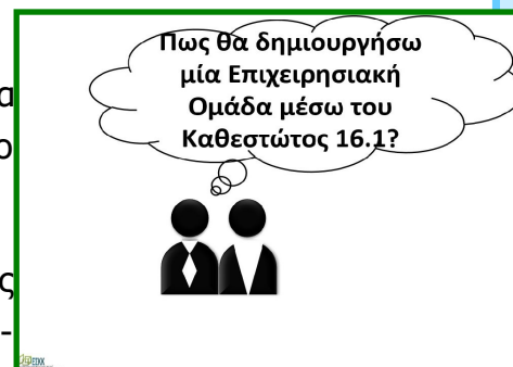
Βρείτε το «slide show» στην ιστοσελίδα μας

Μεταξύ άλλων η υποομάδα του Δικτύου συνεχίζει να παρέχει συμβουλευτικές υπηρεσίες στους αιτητές του Καθεστώτος 16.1 για τη συμπλήρωση των αιτήσεων τους.