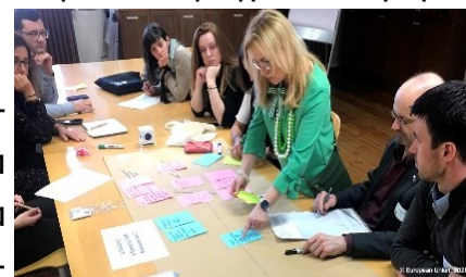
16η Συνάντηση Ευρωπαϊκών ΕΑΔ, Ισπανία

Στη συνάντηση των Δικτύων ("16 th NRN Meeting") συζητήθηκαν: (α) ο ρόλος των Δικτύων στη σύσταση και λειτουργία των Δικτύων Κοινής Αγροτικής Πολιτικής "CAP Networks" κατά την νέα προγραμματική περίοδο 2021-27, (β) οι κύριες προκλήσεις και οι προτεινόμενες λύσεις στη προετοιμασία των εθνικών Δικτύων Κοινής Αγροτικής Πολιτικής και (γ) οι εξελίξεις στις δραστηριότητες των Ομάδων Διαχείρισης και Λειτουργίας των Εθνικών Αγροτικών Δικτύων των κρατών μελών.