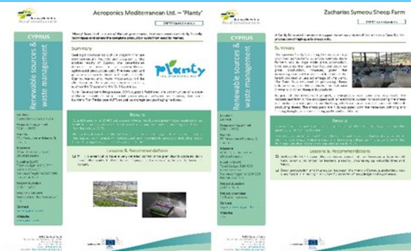
Δημοσιεύσεις έργων καλών πρακτικών από την Κύπρο στο Ευρωπαϊκό Δίκτυο Αγροτικής Ανάπτυξης (ENRD)

Η Ομάδα Διαχείρισης και Λειτουργίας του ΕΑΔ συνεχίζει την υλοποίηση του Σχεδίου Δράσης του ΕΑΔ και την αναζήτηση τέτοιων έργων με σκοπό την περαιτέρω ανάδειξη καλών μεταβιβάσιμων πρακτικών ανάμεσα στα έργα που υλοποιούνται από το ΠΑΑ Κύπρου.